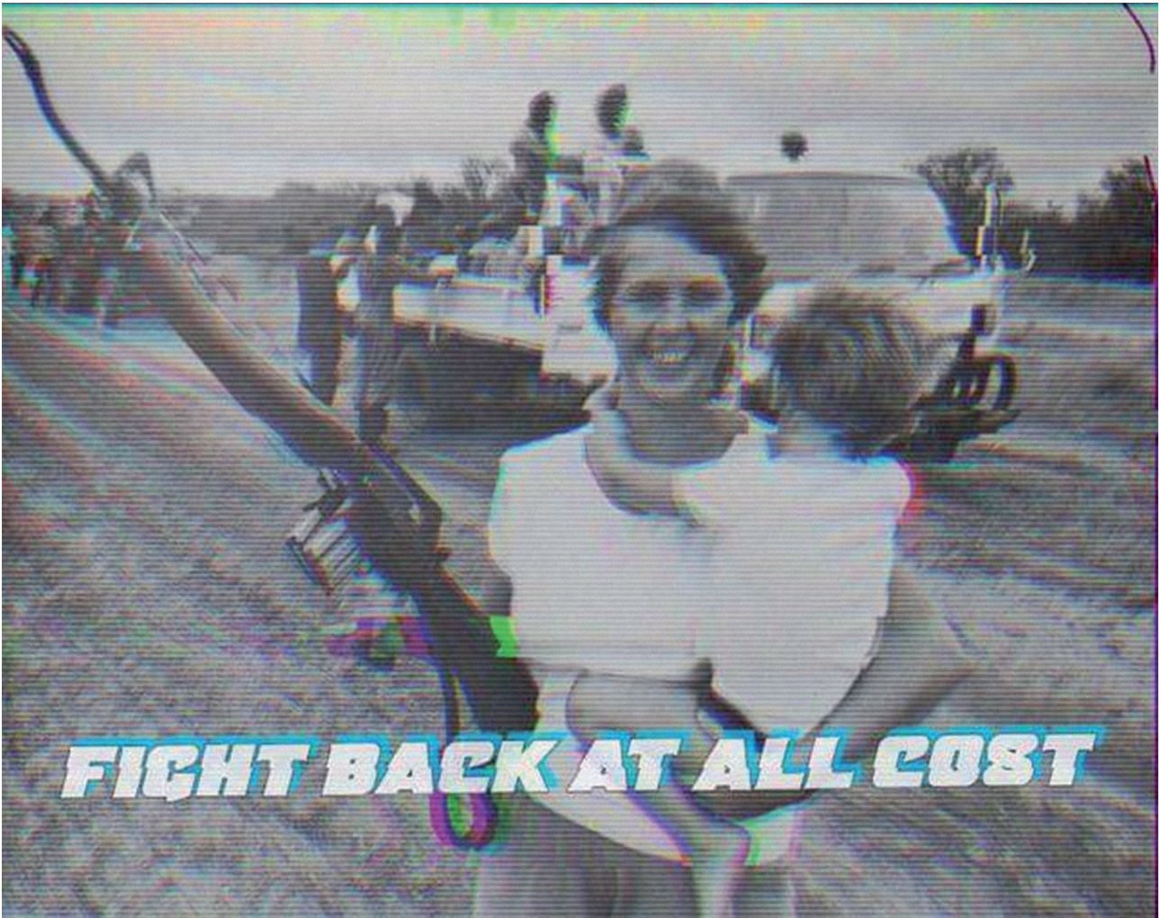
„ქართული ძალა“, 20 ივნისი, 2018

ისტორიული რემიქსის ფოტოების წყარო არ არის მხოლოდ ქართული კონტექსტის ისტორიული მესხიერება. ის იკვებება მსოფლიო ისტორიიდან მოხმობილი ფრაგმენტებითაც. ხშირად ახსენებენ ისრაელის მილიტარისტულ პოლიტიკას – საქართველოსაც, თუ სურს დაკარგული ტერიტორიების დაბრუნება, მსგავსი პოლიტიკა უნდა ჰქონდეს. სწორედ ამგვარი ნარატივით გვხვდება იარაღიანი ქალებისა და ბავშვების ფოტოები. ერთი მხრივ, გვაქვს ქალის, როგორც სილამაზის, სინამის, მორჩილების განმასახიერებელი სურათები, მეორე მხრივ კი, ფილმებიდან ან სხვა წყაროებიდან იქვე ჩნდებიან მებრძოლი ქალები, რომლებიც სამშობლოს ან ოჯახს ემსახურებიან. შესაბამისად, ახალგაზრდული გვერდი ქალის როლის ორგვარ კონცეპტუალიზიას გვთავაზობს – ოჯახის, სათნოების, სილამაზის სიმბოლოს ალტერნატივა მილიტარისტი ქალის იმიჯია.