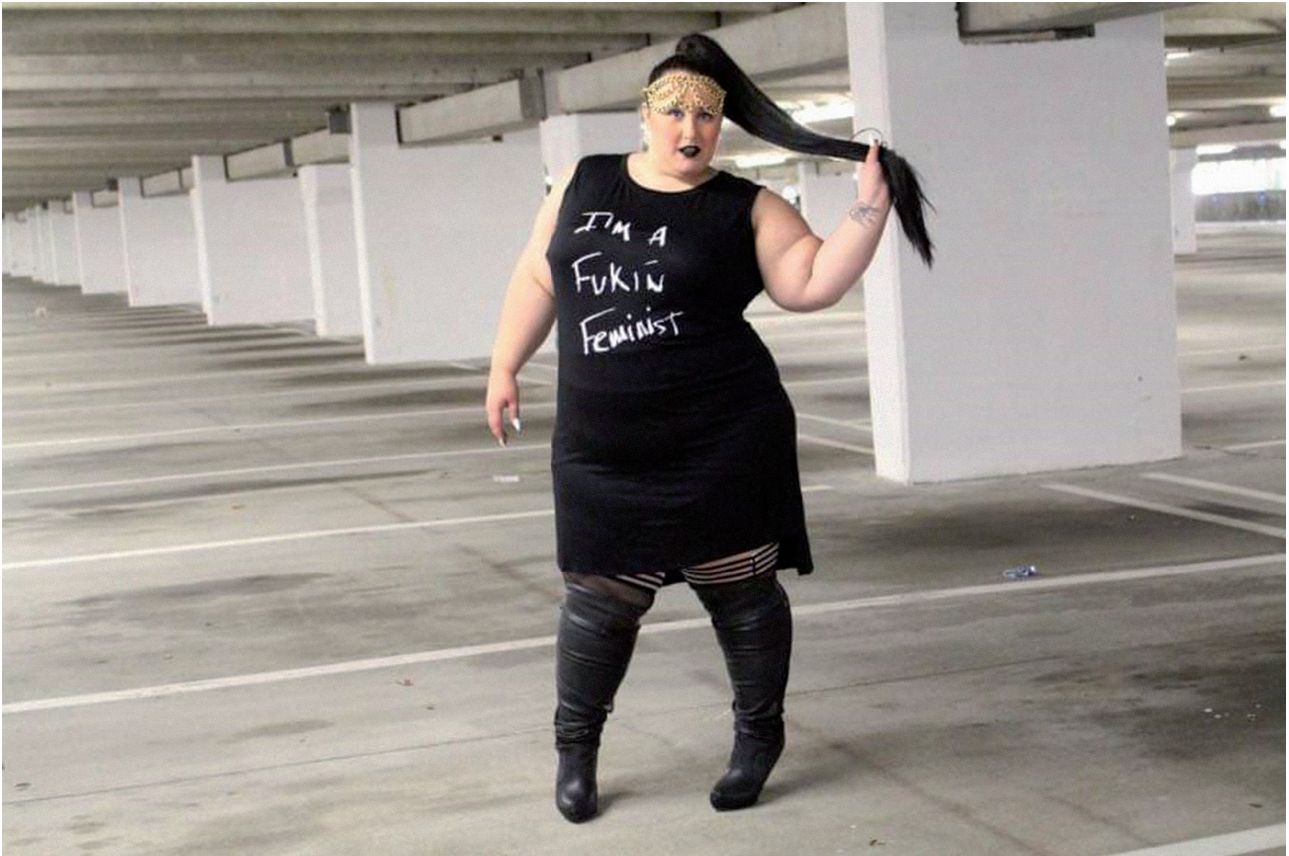
„ქართული ძალა“, 13 ივნისი, 2018

„ქართული ძალის“ შემთხვევაში ამგვარი მიდგომა „ქართულ სისხლსა“ და „ქართულ გენეტიკასთან“ კონტრასტს ქმნის. რჩება განცდა, რომ ქართველი ქალი, მისი გარეგნობა, მორჩილება და ოჯახის ან სამშობლოსთვის თავგანწირვა ფემინისტი ქალისთვის უცხოა. გვხვდება გარეგნობაზე ქილიკი და შეურაცხმყოფელი კომენტარები.