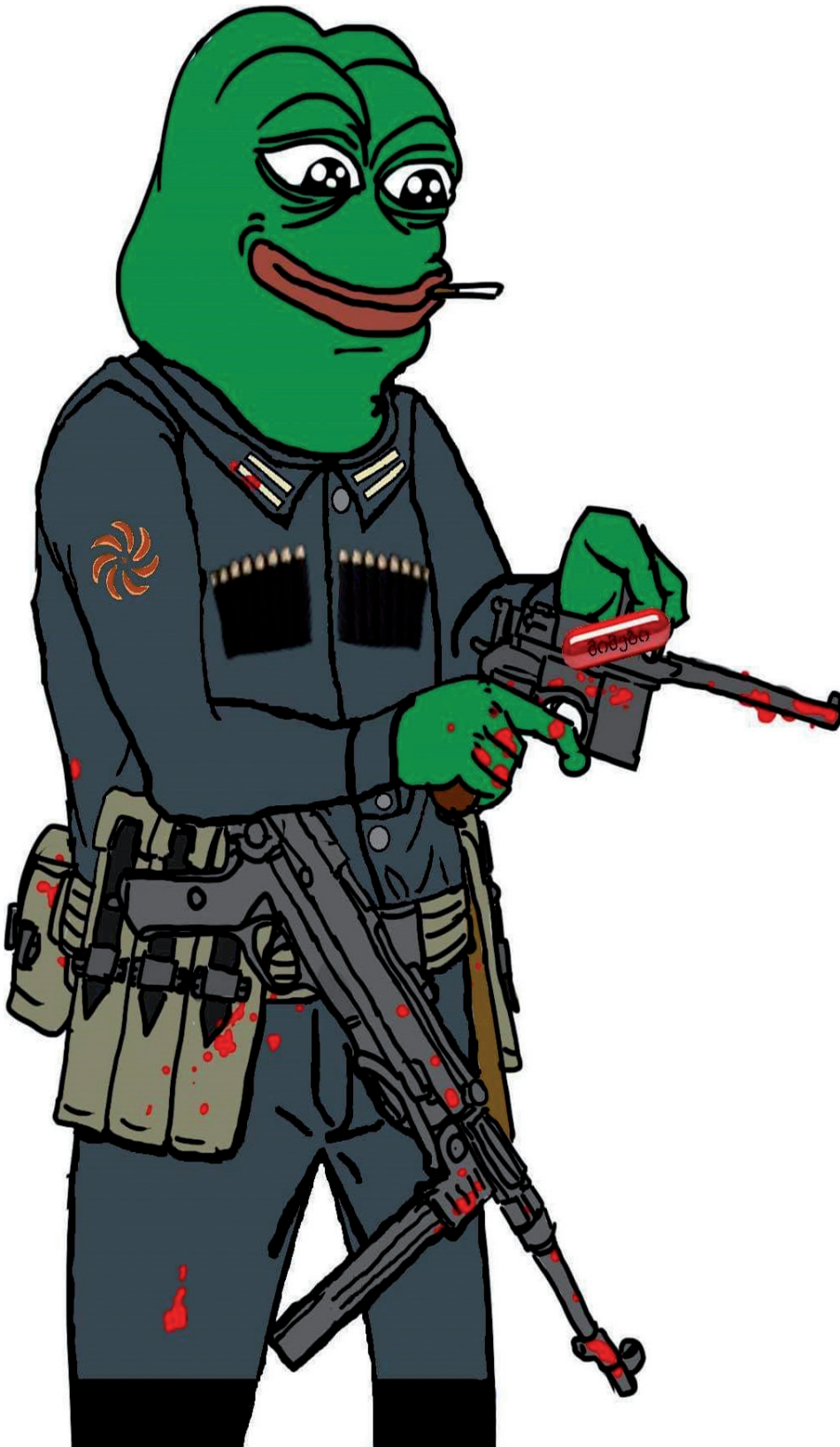
„ქართული ძალა“, 12 ივლისი, 2018