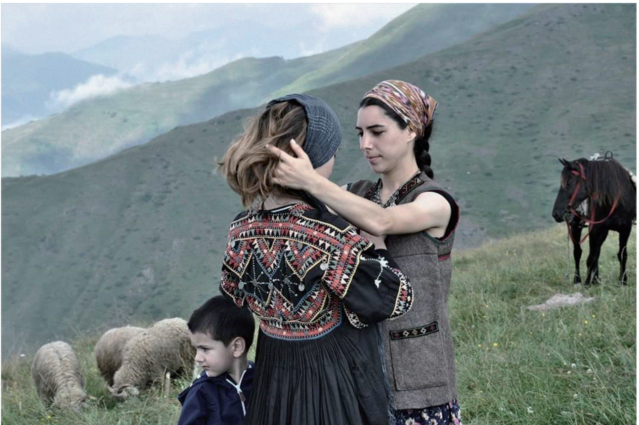
„ქართული ძალა“, 2 ოქტომბერი, 2018

ფიზიკური, გარეგნული, ბიოლოგიური მახასიათებლები „ქართული ძალის“ მიმეგში მნიშვნელოვანი თემაა. ეთნიკური, რასობრივი ნიშნით დახასიათებული უცნობი თუ საჯაროდ ცნობილი ადამიანების ფოტოები ჯგუფის ფეისბუკ გვერდზე შესაბამისი ტექსტით გვხვდება. ქალების შემთხვევაში ხაზგასმულია კანისა და თმის, თვალების ფერი, აღნაგობა, მოკრძალებული ჩაცმულობა ან ტრადიციული ქართული ნაციონალური სამოსი. ქალები უმეტესად ბუნების ან ცხოველების ფონზე არიან, რაც ველური რომანტიზმის, წარსულისა და ქალის ტრადიციული როლისადმი ნოსტალგიის ასოციაციას იწვევს. ასევე ჩანს ქალაქისა და სოფლის დაპირისპირება, როგორც ხელოვნურისა და ბუნებრივის კონტრასტი, ამ კონტექსტში ქალი წარმოდგენილია ბუნების ფონზე, სოფლად და, შესაბამისად, „ბუნებრივ მოვლენად“.