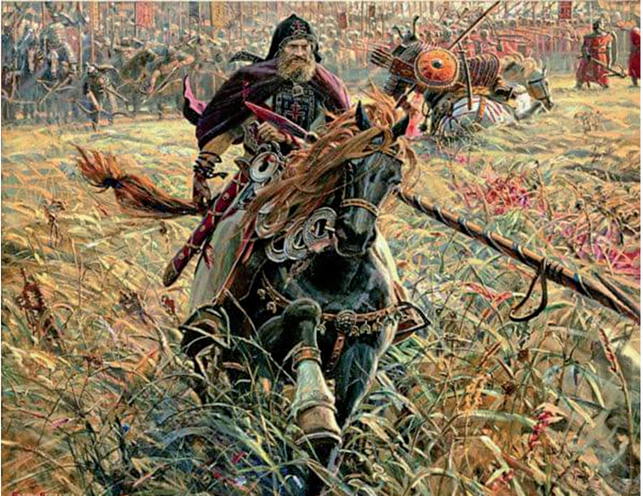
ფოტო #1 – კონტექსტუალიზებულია მარაბდის ბრძოლა 2 ივლისი, 2018 89

საქართველოს პირველი რესპუბლიკის დროშა და აფხაზეთის ომში მონაწილეთა ფოტოები, ქალები ან ბავშვები იარაღით, სხვადასხვა ისტორიული ფრაგმენტის კონტექსტუალიზაცია ერთ ფოტოში – „ჰიპსტერული“ ფოტო ფილტრების, გაბუნდოვანების ეფექტის, ფერების თამაშის, პოპ-არტ კულტურის ესთეტიკის გამოყენება ფოტოებს მიმზიდველს ხდის ახალგაზრდა მიმდევრებისთვის.