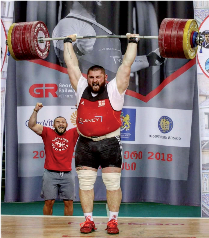
„ქართული ძალა“, 22 სექტემბერი, 2018

თუ „ქართველი ქალის“ საპირისპირო პოლუსი ფემინისტი ქალია, ქართველი კაცი ანტიგმირები ნარკომომხმარებლები და ალკოჰოლზე დამოკიდებული ახალგაზრდები არიან. ამგვარ ინტერპრეტაციაში ნარკოდამოკიდებული მამაკაცი სუსტი და უძლურია, რომელიც ვერ შეასრულებს თავის უმთავრეს ვალდებულებას – ომის შემთხვევაში სამშობლოს ვერ დაიცავს.